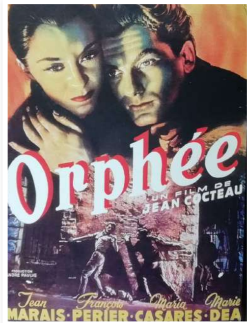
Afiche película Orphée dirixida por Jean Cocteau, 1950.

carreira como actriz no Théâtre des Mathurins, en París; con apenas vinte anos ocupa as portadas das revistas de moda e é eloxiada pola crítica máis esixente, que vai prezando o seu francés de sotaque galego. O cinema, un mundo no que ela nunca se vai sentir cómoda, tamén a reclama; o seu primeiro papel será en Les enfants du paradis , dirixida por Marcel Carné e estreada en 1945, considerado o mellor filme francés de todos os tempos. Outros filmes emblemáticos na cinematografía gala, como Les dames du Bois