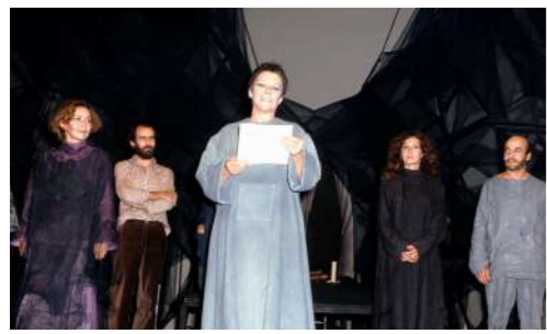
Estrea da obra El Adefesio, setembro 1976. María Casares le no escenario as palabras de Rafael Alberti, aínda naquel momento exiliado en Roma ao non estar legalizado aínda o PCE.

Grandes papeis nos últimos anos de vida. Ponse na pel do Papa en Elle de Jean Genet, tamén con Sobel; da raíña Hécube , na traxედია de Eurípides, con dirección de Bruno Bayen, e participa nas Comedias Bárbaras de Valle Inclán co director Jorge Lavelli, que abrirán o Festival de Avignon en 1991. Son anos de recoñecementos e premios como o Molière, o Nacional de Teatro en Francia ou a nominación aos César polo seu papel no filme La lectrice . María Casares morre de cancro o 21 de novembro de 1996; pouco antes a Asociación de Actores e Actrices de Galicia puxérase en contacto con ela para poñer o seu nome aos seus galardóns anuais.