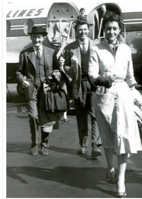
María Casares, Gérard Philipe et Jean Vilar, Xira do Théâtre National Populaire por Canadá e EUA, 1958.

Afianza a súa carreira como actriz, coa condición de “gran traxica”, escollendo o teatro como o seu refuxio para a vida. Tras o paso, breve, nos primeiros cincuenta, pola Comédie Française, da que sae entre outras razóns polos problemas administrativos derivados da súa condición de