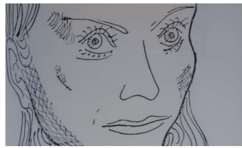
Figuracións , de Luis Seoane. O artista fixo os apuntamentos do debuxo cando coñece a actriz en Arxentina en 1957; o debuxo será publicado en febreiro de 1974 en La Voz de Galicia , como parte da serie Figuracións que entre 1971 e 1974 Seoane desenvolve no xornal. Fundación Luis Seoane.

O legado de Alloue (Francia), a finca de La Vergne que a actriz adquire a principios dos anos sesenta do pasado século, é sen dúbida a herdanza viva dunha actriz de enorme xenerosidade que deixa o seu patrimonio en