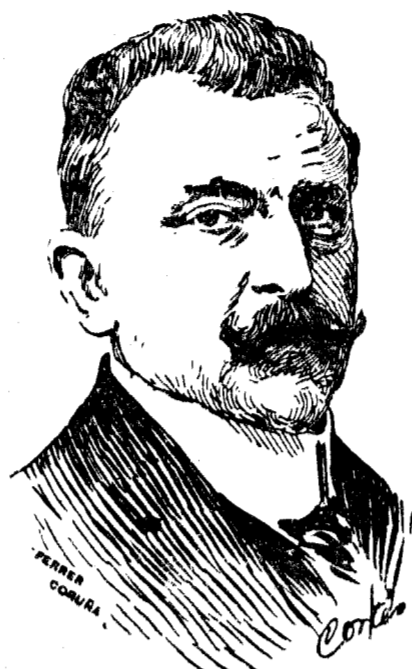
EL MINISTRO DE ESTADO, SR. JIMENO

El espíritu menos fácil de contentar, si examina la situación presente con sereno juicio y se para en considerar nuestra situación respecto a las demás naciones europeas al presente enredadas en un litigio sin precedentes en punto a cuantía, tendrá que reconocer que la respuesta dada por el Gobierno de España al Gobierno germano, no ofrece punto vulnerable.